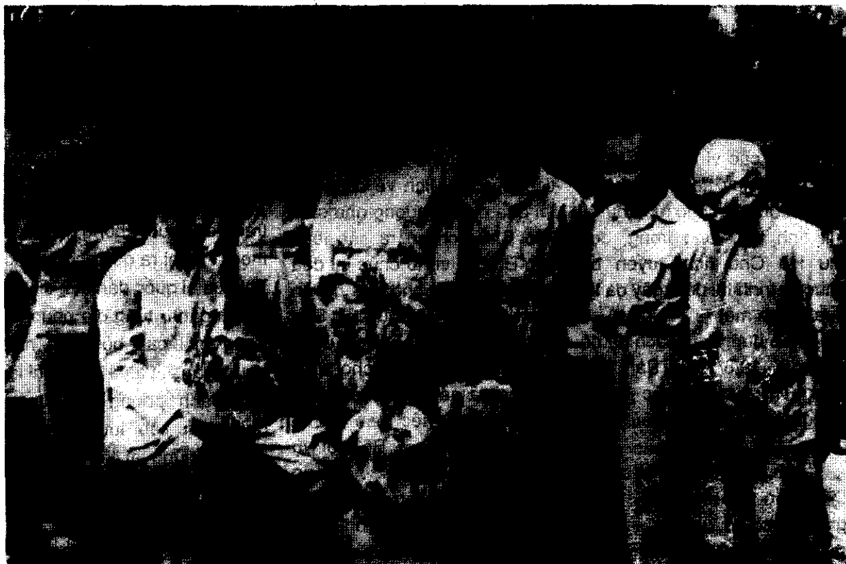
Hồ Chủ tịch và các đồng chí lãnh đạo nói chuyện thân mật với các Chiến sỹ thi đua trong quân đội Đại hội Anh hùng và Chiến sỹ thi đua toàn quốc năm 1952

(10) Phòng Tổng Liên đoàn Lao động Việt Nam, hồ sơ 45: Chỉ thị của Tổng Liên đoàn Lao động Việt Nam về việc tổ chức các đợt thi đua trong năm 1951.