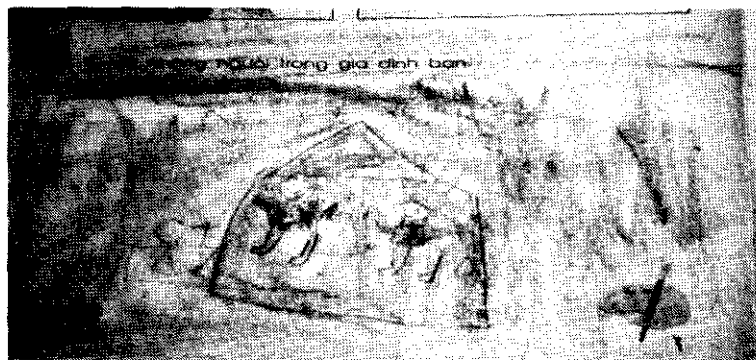
Hình minh họa số 1

Cũng có thể, bố của B ít khi ở nhà nên vai trò trong gia đình không lớn, cậu bé đã bỏ quên; cô em gái là nhân vật mới trong nhà như là một người tranh giành với mẹ - người mà vốn vẫn gần gũi cậu bấy lâu nay, có thể cậu không muốn vẽ.